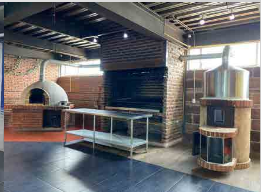
*Imágenes ilustrativas correspondientes a diversos planteles de Grupo ISIMA.