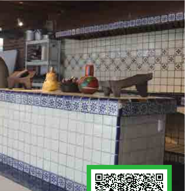
*Imágenes ilustrativas correspondientes a diversos planteles de Grupo ISIMA.

Manlio Fabio Altamirano No. 322, Esq. Mariano Arista, Col. Tajín, C.P. 93330 Poza Rica, Veracruz.