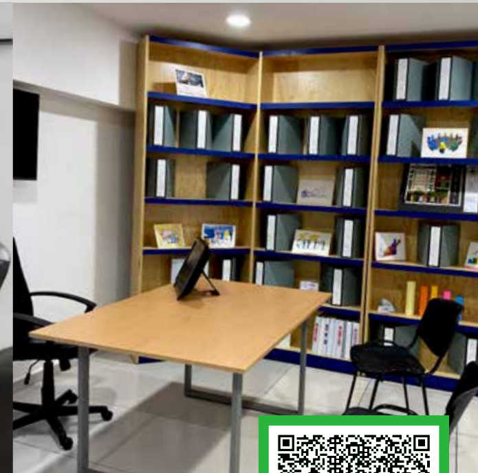
*Imágenes ilustrativas de diversos planteles de Grupo ISIMA.

📍 Calle 43 Oriente ó Blvd. Lic. Luis Sánchez Pontón No. 607, Col. San Baltazar Campeche, Zona Dorada, C.P. 72550, Heróica Puebla de Zaragoza, Pue.