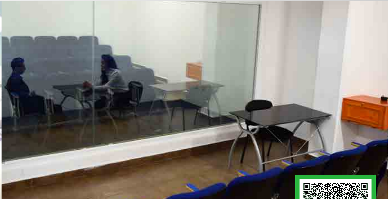
*Imágenes ilustrativas correspondientes a diversos planteles de Grupo ISIMA.

📍 Jaime Nunó No. 204, Ext A, Col. Revolución, C.P. 42060, Pachuca de Soto, Hidalgo.