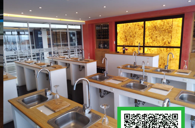
*Imágenes ilustrativas correspondientes a diversos planteles de Grupo ISIMA.

Av Francisco I. Madero Ote 657, Centro histórico de Morelia, 58000 Morelia, Mich.