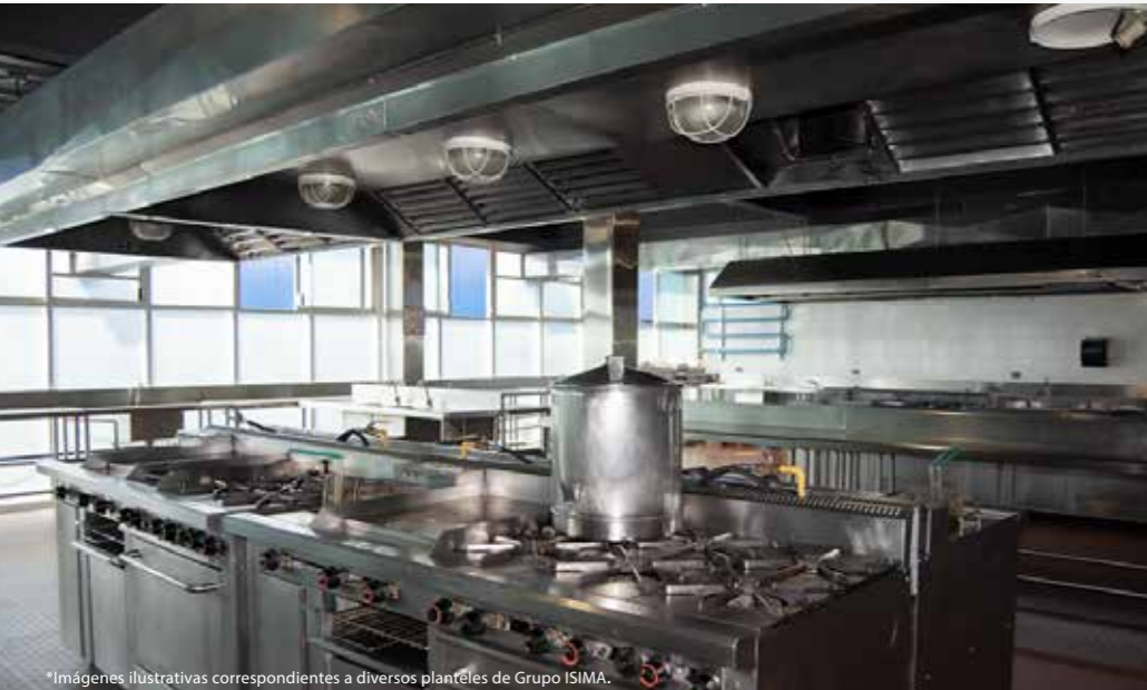
*Imágenes ilustrativas correspondientes a diversos planteles de Grupo ISIMA.