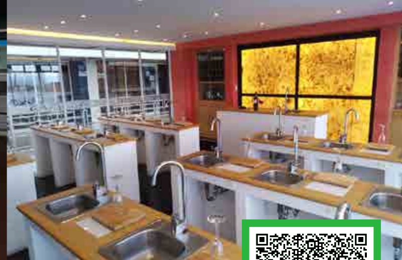
*Imágenes ilustrativas correspondientes a diversos planteles de Grupo ISIMA.

Escanea el código para hablar con un asesor