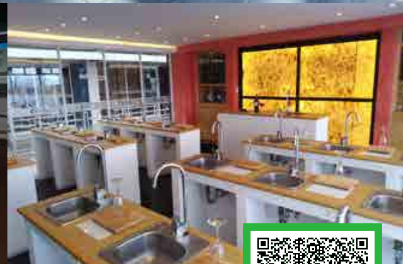
*Imágenes ilustrativas correspondientes a diversos planteles de Grupo ISIMA.

Francisco Sarabia #75, Colonia Santa Julia 36667, Irapuato, Guanajuato.