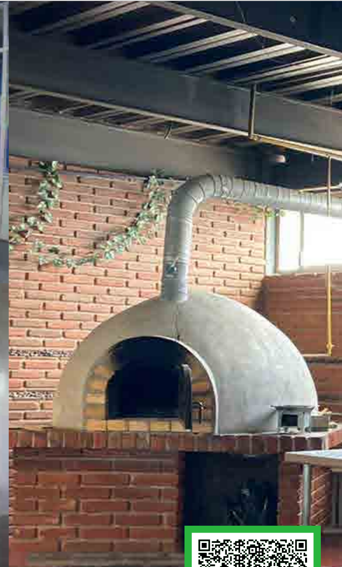
*Imágenes ilustrativas correspondientes a diversos planteles de Grupo ISIMA.

📍 Raymundo Abarca Alarcón No. 2 Int. 2, Esq. Miguel Alemán, Col. Centro, C.P. 39000, Chilpancingo, Guerrero. ✉ chilpancingo@isima.com.mx ☎ (747) 472 7345