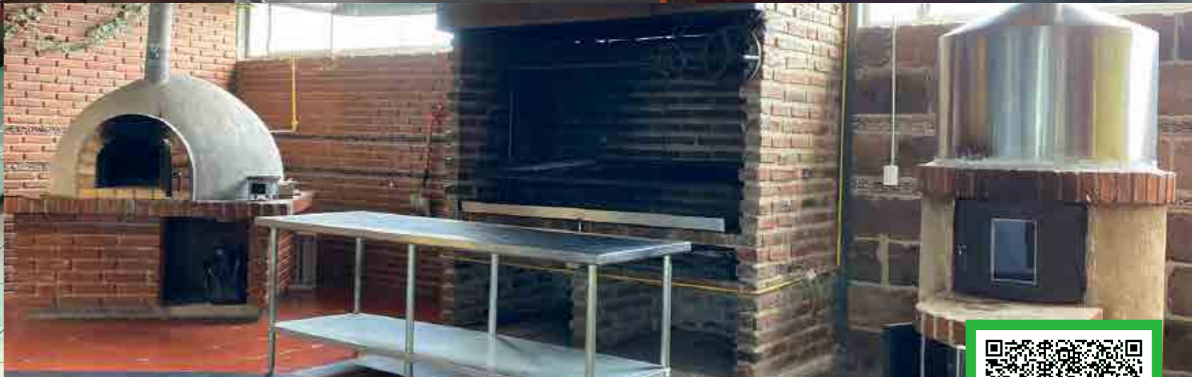
*Imágenes ilustrativas correspondientes a diversos planteles de Grupo ISIMA.

Av. Adolfo López Mateos Ote. No. 329, Esq. 16 de Septiembre, Barrio del Encino, Zona Centro, C.P. 20240 Aguascalientes, Ags. aguascalientes@isima.com.mx (449) 918 2845